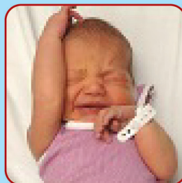
Movimentos corporais agitados