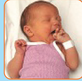
Mão na boca