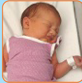
Aumentando o movimento