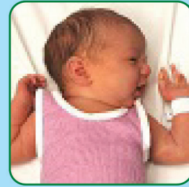
Vira a cabeça procurando