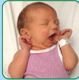
Abre a boca